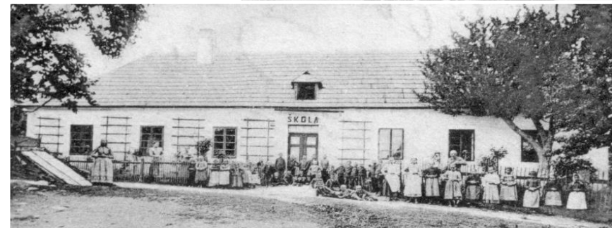
Obrázek 1: Evangelické kostely a škola ve Velké Lhotě. Převzato z pohlednice z r. 1901.

Velká Lhota zur Zeit der Wiedervereinigung der tschechischen Reformation in der Evangelischen Kirche der Böhmischen Brüder im Jahre 1918.