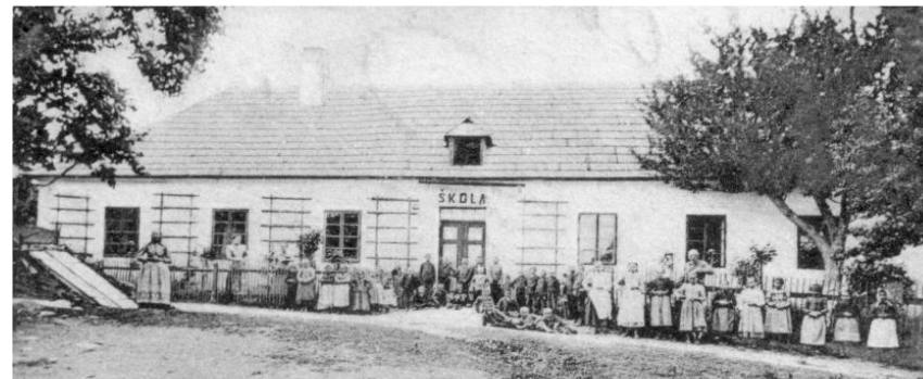
Obrázek 1: Evangelické kostely a škola ve Velké Lhotě. Pevzato z pohlednice z r. 1901.

Velká Lhota v době znovuspojení české reformace v Českobratrské církvi evangelické v roce 1918. Oba kostely, škola a poslední faráři dosavadního reformovaného i luterského sboru.